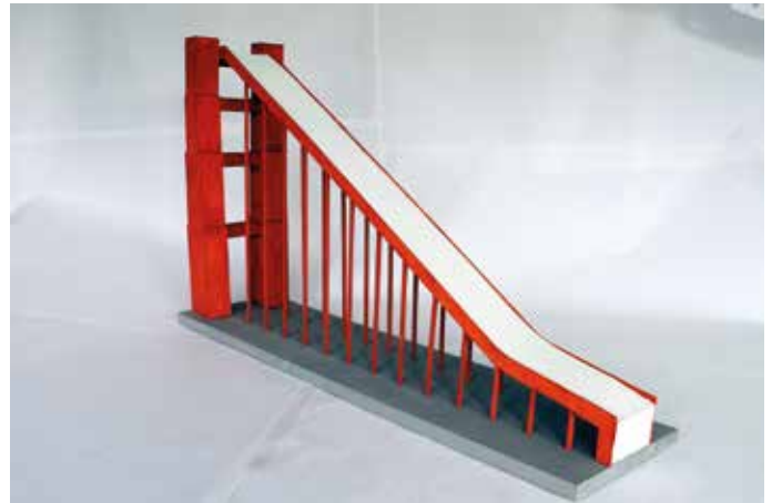
Das Siegermodell der älteren Schülerinnen und Schüler ab Jahrgangsstufe 9: „Golden Gate Jump (est. 2022)“.

Im Wettbewerb der älteren Schülerinnen und Schüler ab Jahrgangsstufe 9 siegten zwei Schülerinnen des St.-Franziskus-Gymnasiums in Olpe mit ihrem Modell „Golden Gate Jump (est. 2022)“. Das Modell „Golden Gate Jump“ orientiere sich dabei am berühmten Vorbild der Golden Gate Bridge in San Francisco. Die Schülerinnen haben sich dabei insbesondere bemüht, den Turm originalgetreu nachzubilden, da die Türme der Brücke symbolisch für die Brücke als Ganzes ständen. Den zweiten Platz belegten fünf Schülerinnen und Schüler des Berufskollegs Geldern mit dem Modell Rheinbraun. Platz drei sicherten sich zwei Schülerinnen des Gymnasiums Am Turmhof in Mechernich mit dem Modell „CJP-Schanze“.