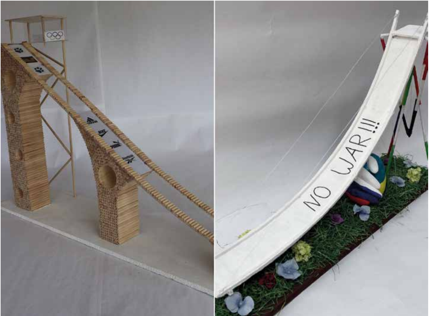
Die Sonderpreise. Links das Modell M & M Skisprungschanze und rechts das Modell „Am seidenen Faden“.

und Platzierten des Wettbewerbs, die uns mit großartigen Modellen begeistert haben. Wir freuen uns sehr, dass auch der diesjährige Wettbewerb den Trend der letzten Jahre bestätigt: Die Siegermodelle kommen regelmäßig auch von Schülerinnen und wir hoffen, künftig noch mehr junge Frauen für den Beruf der Bauingenieurin begeistern zu können. Wir drücken den Siegerinnen die Daumen für das Bundesfinale und wünschen Ihnen eine spannende und erlebnisreiche Reise nach Berlin. Aber auch wer sich diesmal nicht zu den Siegern zählen kann, hat allen Grund, stolz auf seine Leistung zu sein, die oft mit großem Teamgeist, Einsatz und erheblicher Disziplin erreicht wurde.“ Vom 10. Juni bis zum 10. Juli zeigt das Baukunstarchiv NRW in Dortmund alle Modelle aus dem Landesfinale NRW. Junior.ING ist ein Wettbewerb der Bundesingenieurkammer BlnGK und der 15 Länderingeuerkammern. In Nordrhein-Westfalen richtet die Ingenieurkammer-Bau NRW den Wettbewerb unter der Schirmherrschaft des Ministeriums für Schule und Bildung aus. Die Aufgabe in diesem Jahr lautete: Eine Skisprungschanze zu entwerfen und als Modell zu gestalten. Bei der Gestaltung kommt es auf kreative und konstruktive Ideen an und der Fantasie sind keine Grenzen gesetzt.