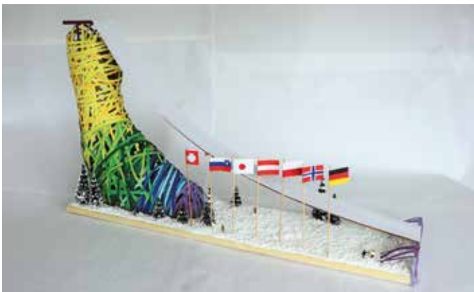
Das Siegermodell der jüngeren Altersstufe bis einschließlich zur Klasse 8: „Ski Jumper“.

In der jüngeren Altersstufe bis einschließlich zur Klasse 8 errangen drei Schülerinnen vom Freiherr-vom-Stein-Gymnasium in Oberhausen den ersten Preis mit dem Modell „Ski Jumper“. Die Jury war insbesondere beeindruckt von der konstruktiven Idee, einen Skischuh als Vorbild zu nehmen und diesen aus Rundbögen zu konstruieren. Daraus ist eine leichte und trotzdem standfeste Stütze entstanden, die durch die besondere bunte Farbgestaltung gefalle, die die Vielfalt der Menschheit symbolisiere. Den zweiten Platz belegten zwei Schüler des Ritzefeld-Gymnasiums Stolberg mit ihrem Modell „Fischtal-Überflieger“. Auf dem dritten Platz landete ein Schüler des Gymnasiums Schloß Holte-Stukenbrock mit dem Modell „Triangulus-Fly“.